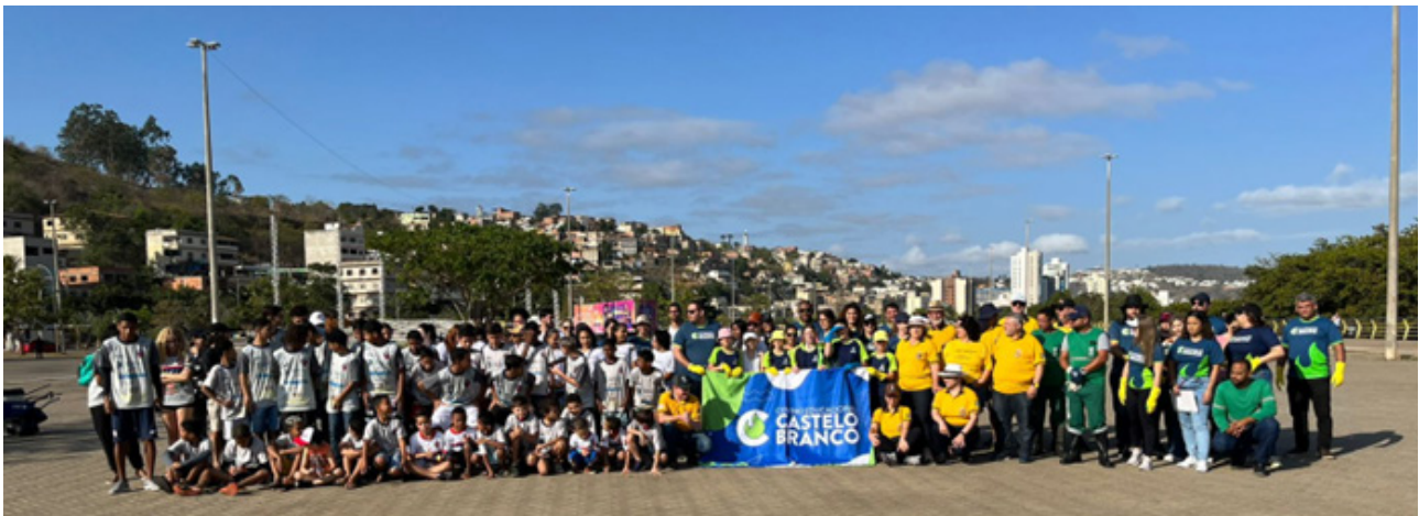
Lions Colatina realiza limpeza das margens do Rio Doce em atendimento a campanha do Distrito